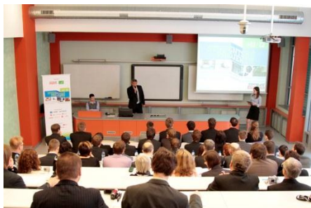
Obhajoby studentských projektů.