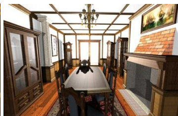
1. místo nábytkářská kat.- Róbert Ozoroczy