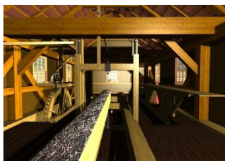
1. místo stavařská kat.- Jiří Horáček