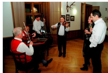
Společenský večer – zámek ve Křtinách