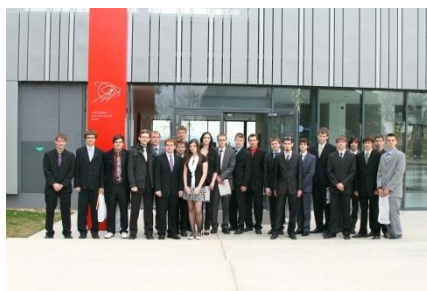
Vyhlášení výsledků soutěže – Hvězdárna Brno