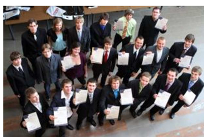
Finalisté 5. Ročníku soutěže.