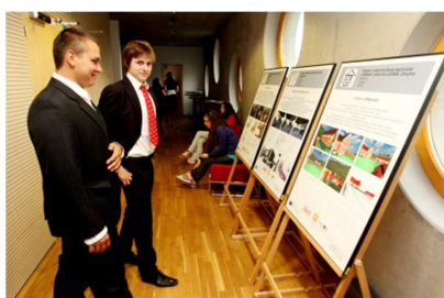
Galerie projektů ve Studijní a vědecké knihovně v Hradci Králové.